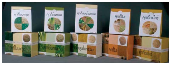
รูปที่ 6 ผลงานที่สนใจนำเสนอ