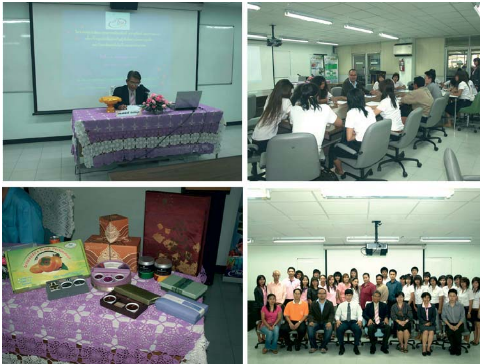
รูปที่ 5 กิจกรรมโครงการพัฒนาคุณภาพผลิตภัณฑ์ บรรจุภัณฑ์ และการตลาด เพื่อสร้างมูลค่าเพิ่ม สำหรับผู้เข้ารับมเพาะธุรกิจ มทร.พระนคร