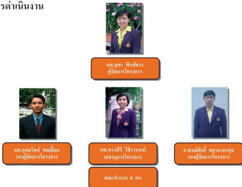
รูปที่ 2 คณะกรรมการอำนวยการและคณะกรรมการดำเนินงานศูนย์บ่มเพาะธุรกิจ มหาวิทยาลัยเทคโนโลยีราชมงคลพระนคร