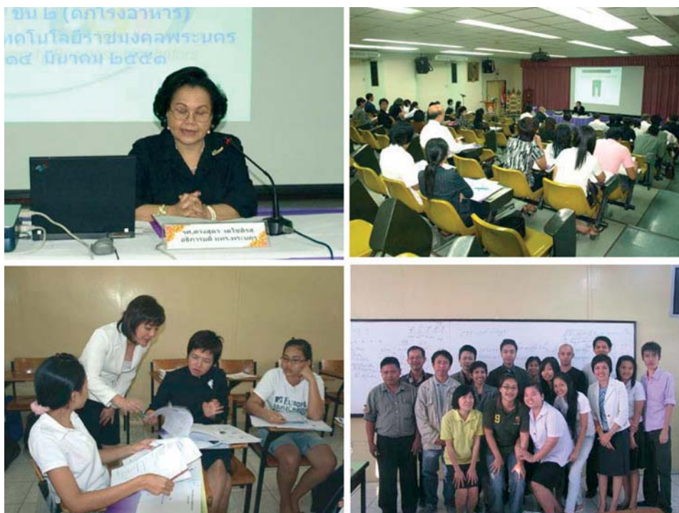
รูปที่ 4 กิจกรรมโครงการอบรมเชิงปฏิบัติการ การเขียนแผนธุรกิจสำหรับผู้ประกอบการธุรกิจเทคโนโลยี