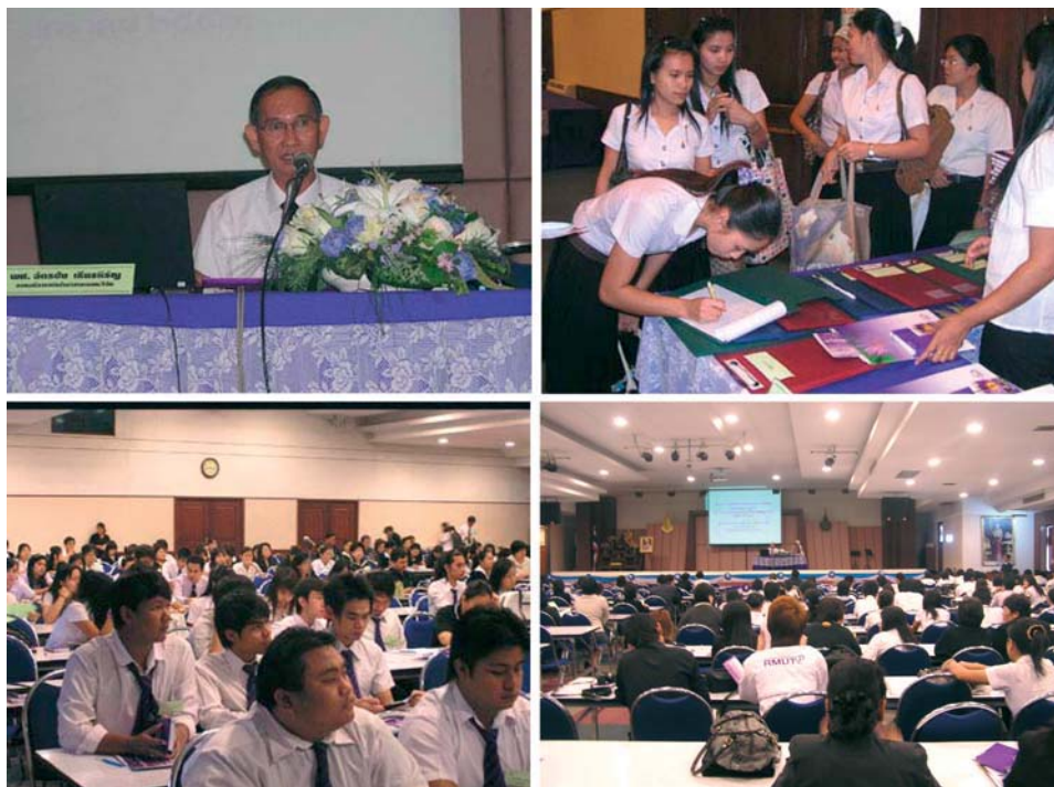
รูปที่ 3 กิจกรรมโครงการสัมมนาเปิดโครงการจัดตั้งศูนย์บ่มเพาะธุรกิจ