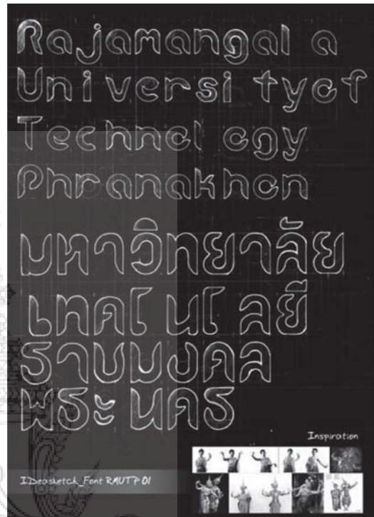
รูปที่ 1 แสดงชุดตัวอักษรจากแนวคิดรำไทย (Thai Dance)

จากรูปที่ 1 สื่อถึงความอ่อนช้อยแต่แฝงด้วยความสง่างาม เป็นเอกลักษณ์ไทยซึ่งหาชาติใดมาเปรียบได้ยาก