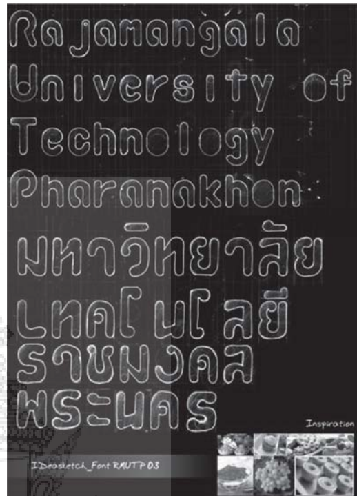
รูปที่ 3 แสดงชุดตัวอักษรจากแนวคิดขนมไทย (Thai Dessert)

จากรูปที่ 2 สื่อถึงความเชี่ยวชาญทางเทคโนโลยี ผลิตบัณฑิตนักปฏิบัติสู่โลกอาชีพ ให้ความรู้สึก แข็งแกร่ง และทันสมัย