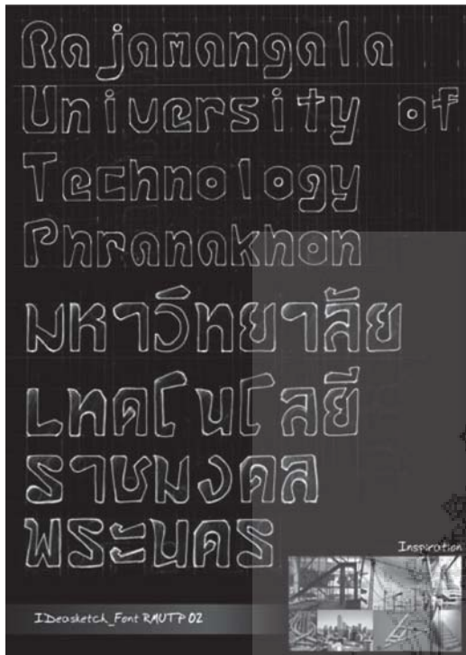
รูปที่ 2 แสดงชุดตัวอักษรจากแนวคิดนักปฏิบัติ (Hand-on)